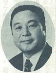
商工常任委員長 衆議院議員