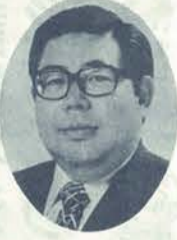
労働政務次官 衆議院議員

私も国政の場から、平和な郷土と、豊かな繁栄のため全力をつくすことを、お誓い申し上げます。日立料飲業と組合員の皆様方の繁栄とご多幸を祈念いたします。