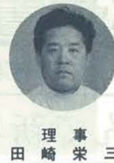
理事 三 栄